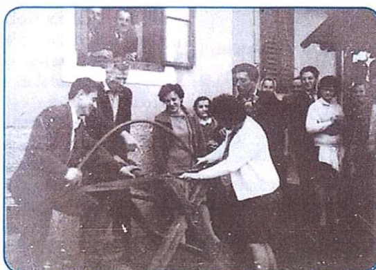
POD ZVEJZDAMI SMO SPALI stran 8