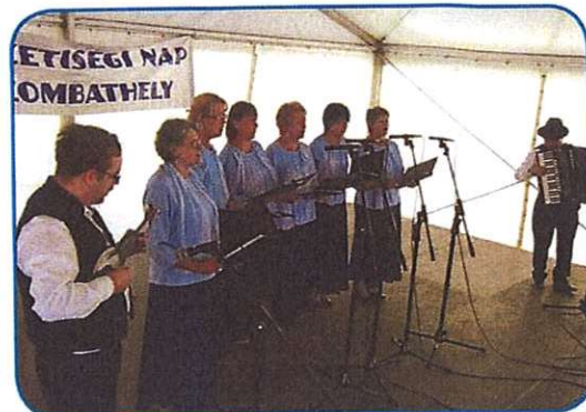
Sombotelške spominčice so letos stare 15 lejt

s kreppapéra. Deca so meli eške eden veuki plastični grad za skakati pa so leko farbaste balone küpüvali. (Nej gvüšno, ka je tau v muzejsko ves, na