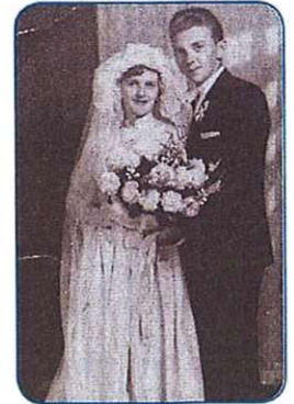
TAUGA NEMO MOGO... stran 8