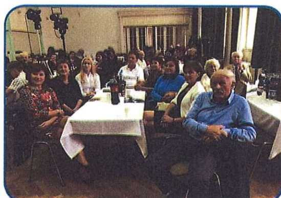
Dvorano so napolnili povabljeni gostje pa členu sombotelskoga slovenskoga društva