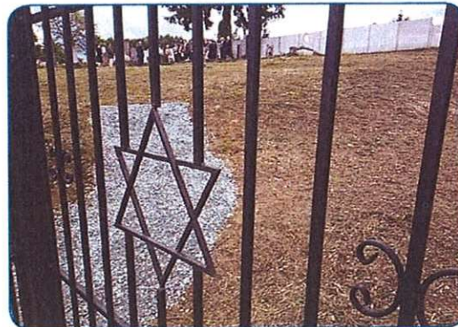
OBVNOVILI SO MONOŠTRSKO JUDOVSKO POKOPALIŠČE stran 5