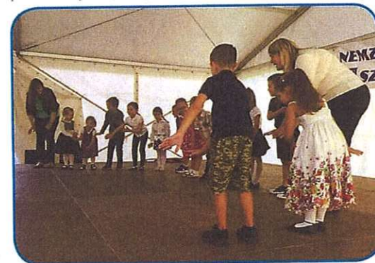
Mlajši z vrtca Mate Meršič Miloradić so pokazali, kak vöter fudi

skupine komaj što pogledne. Depa letos se je pokazalo, ka je tau nej mujs, vej je pa cejli program samo dve vöri trpo, če rejsan je gorstau pilo više deset šaulski pa štiri »stare« skupine. Prauti večeri se je s slovenske izže čüla igrauta. Naši lidgé so eške dugo spejvali pa se pogučavali ino si obečali, ka kleti pá pridejo - na 17. Narodnostni den v Sombotelu.