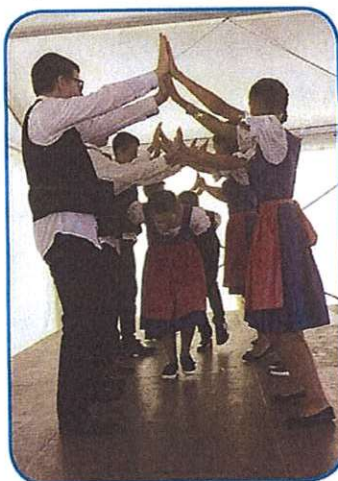
Veseli nemški plesci 8. klasa Osnovne šaule Antal Reguly

narodnostni den valon bilau.) Ništerni premišlavajo, ka bi mogla meti deca ejkstra program od vözraščeni. Vej pa na začetki srečanja je vsikdar spoj dosta starišov, šteri pa so samo na svoje mlajše najgir. po njini nastopaj tak naglo taodletijo, ka vözraščene