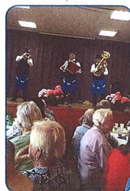
MI SE MAMO RADI ... stran 9