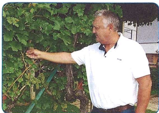
BICIKLIJADA IN DŌDOLIJADA stran 5