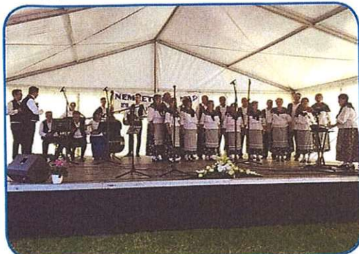
Rovački pevski zbor Djurdjice je gorstauo vküper s tamburaškov skupinov Guslice

bás Tóih z rovačkoga vrtca. Njini dve vözraščeni kulturni skupini sta bili prvivi v redej: