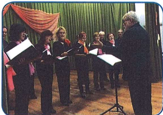
Komorni peuski zbor ZSM iz Monoštra

nje perdja itd.) gde je pesem vsigdar pauleg bila, gde so se mladi od starejši včüli. Zatok je samo