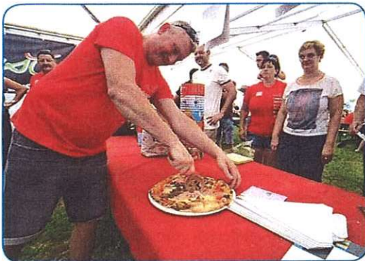
MED KEDNOM DRVAR, KONEC KEDNA KÚJAR stran 4