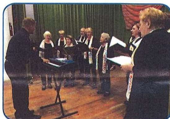
Zbor Pavlove hiše iz Potrne