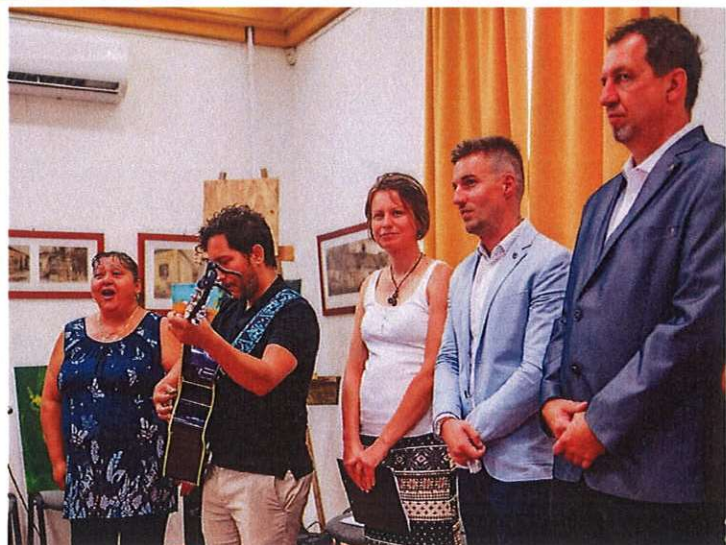
(Szombathely-Herény, 2020. augusztus 14.)