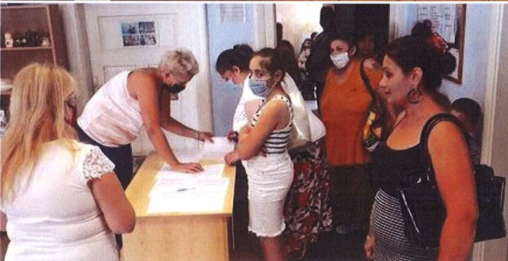
(Szombathely, 2020. augusztus 27.)