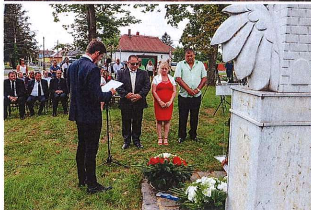
(Bük, 2020. augusztus 3.)