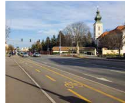
Szent Márton utca