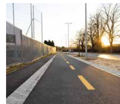
Náriai külső út