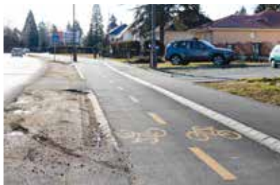
Szent Imre herceg utca