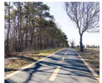
Szombathely – Sé