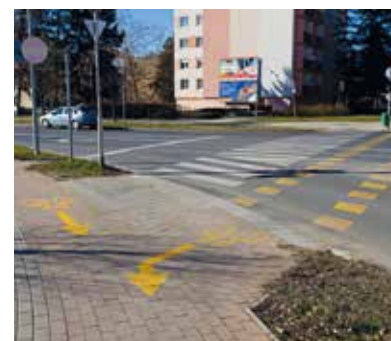
Rohonci út – Bartók Béla krt. csomópont