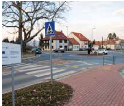
Nárai utca – Brenner krt. körforgalmi csomópont