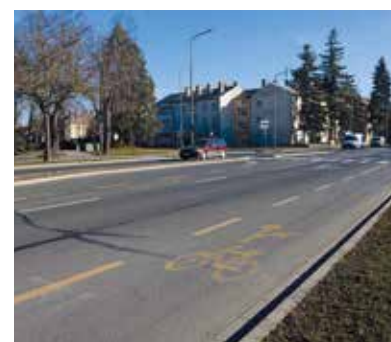
Bartók Béla krt.