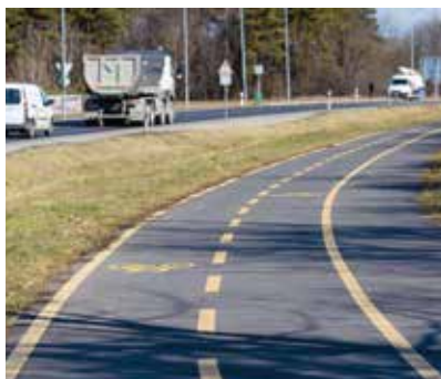
Metro körforgalom és a Söptei úti körforgalom között