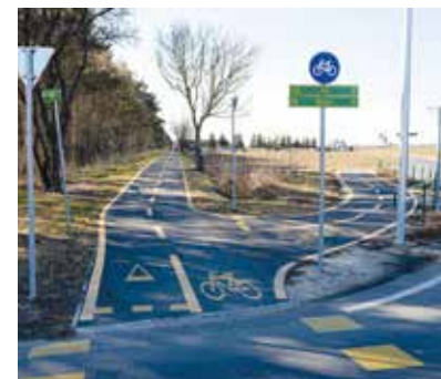
Szombathely – régi Bucsui út